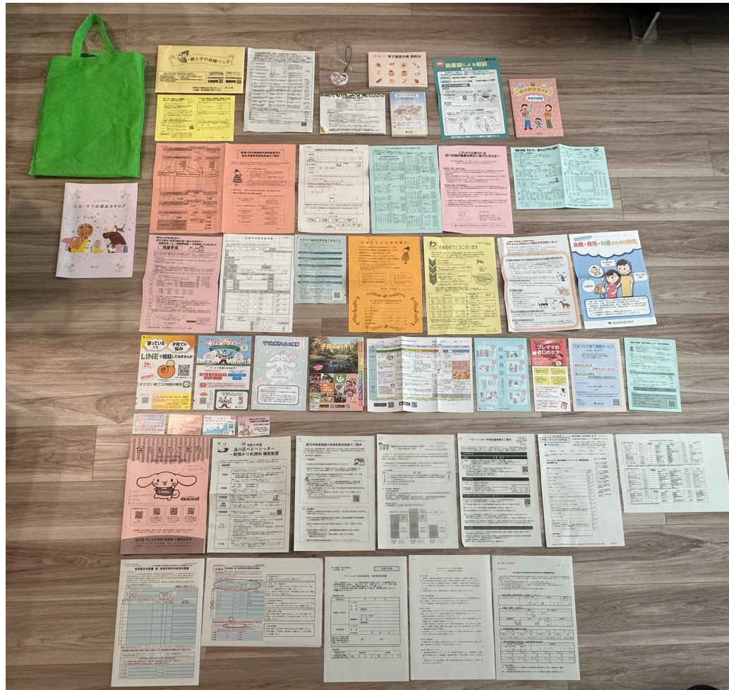
妊娠届提出時に受け取った書類

受け取った書類には 提出すべきものとお知らせ が混在し、内容を把握・理解するのに苦労しました。