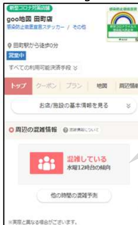
goo地図上の個別店舗画面